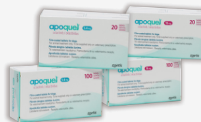
La imagen del producto es de referencia.

N-metil [trans -4- (metil -7H- pirrolo [2,3-d] pirimidin-4-ilamino ciclohexil] methanesulfonamida (2Z) -2- butenedioato.